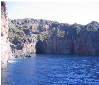
eine Bucht auf Vulcano