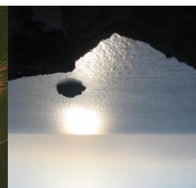
tramonto auf Lipari