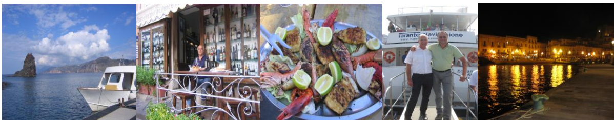
Landgang auf Salina