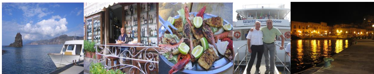
Landgang auf Salina