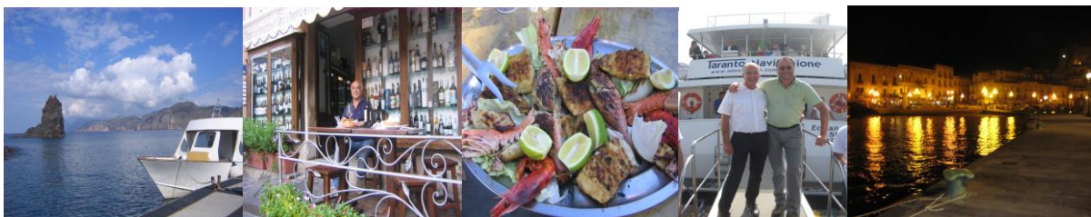
Landgang auf Salina