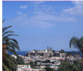
das Castello di Lipari