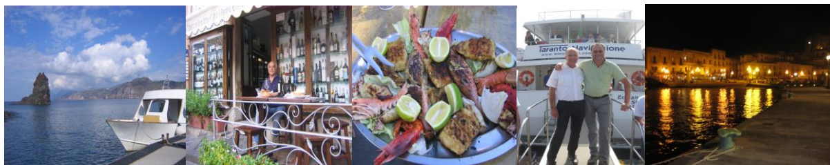
Landgang auf Salina