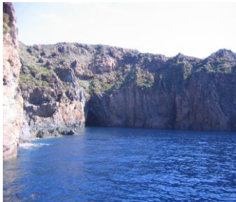
eine Bucht auf Vulcano